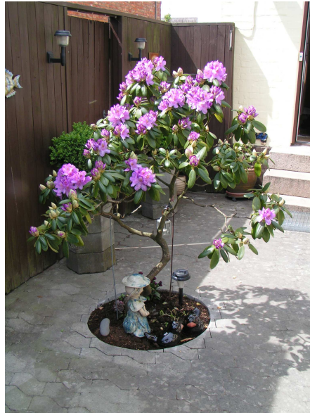
Original størrelse er 1,31 MB

Det sker ofte, at man har billeder på sin computer, som man gerne vil sende til familie, venner og bekendte. Det kan være alt fra fotos fra digitalkameraer og scannede billeder til billeder, du har downloadet fra internettet.